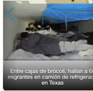
Entre cajas de brócoli, hallan a 60 migrantes en camión de refrigerado en Texas